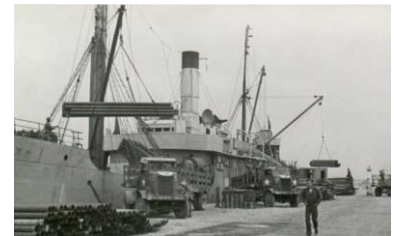
Det Danske skib Avance under forberedelse til D-dagen

Vi mødes foran Jyllinge bibliotek 10:20.